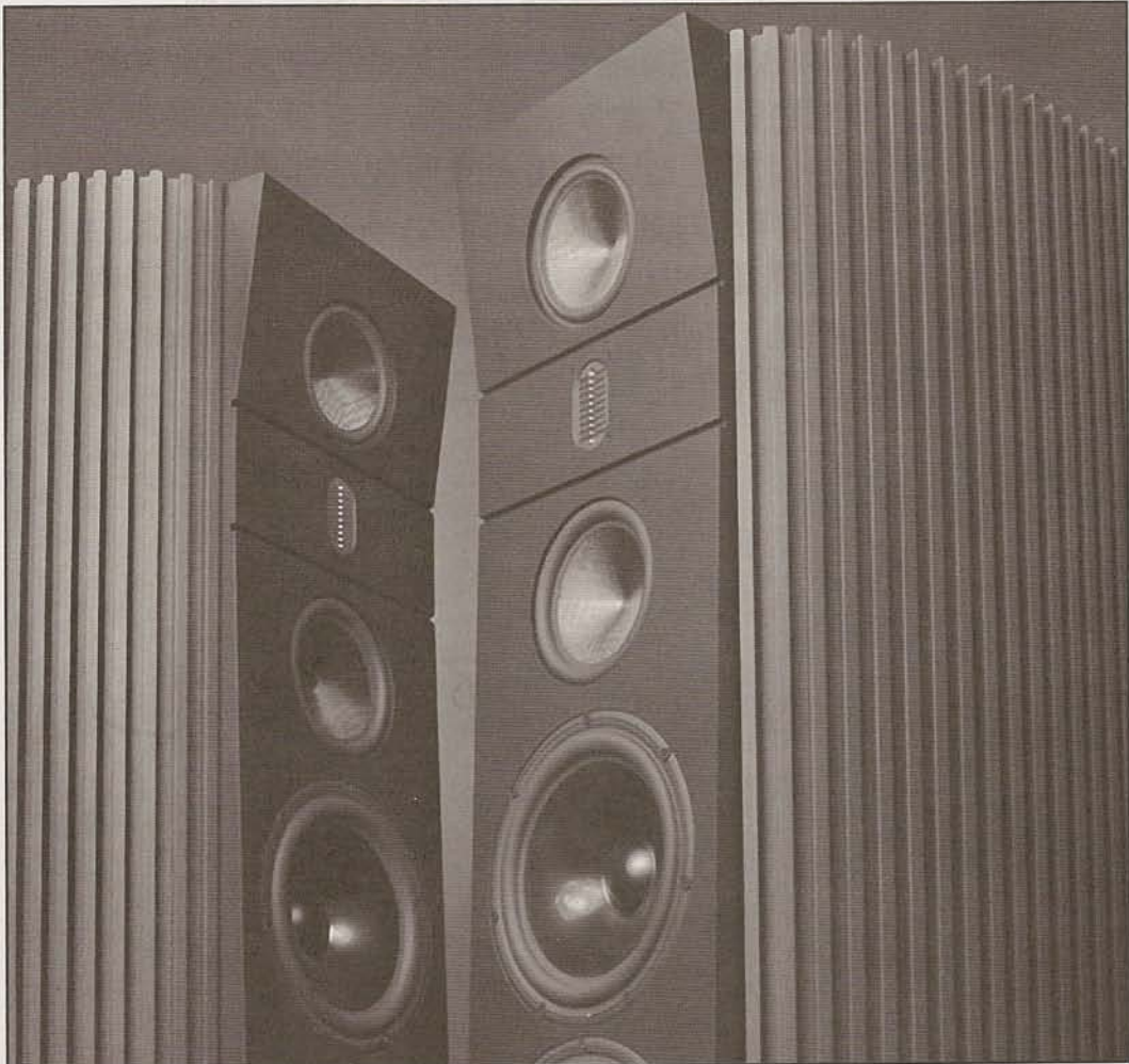
Model 6 Series 2 鋁箱表面的割切方式有助聲音擴散。

令我印象深刻，他特別播放了一些定位、瞬變、低頻和動態特別出色的錄音，在 SPECTRAL 晶體管前後級組合推動之下，Model 6 Series 2 的音效可用「Hi-Fi 無倫」來形容，在我歷來聽過出自每聲道一個音箱的揚聲器體系之中，這是高低頻伸延度最好和爆棚動態最驚人的示範，而與此同時，Model 6 Series 2 音色之優美和動態之強烈亦有懾人表現，無論人聲、小提琴、結他和二胡等都靚聲到令人說不出話來，如果說，世上有什麼揚聲器的音效好到值得百多萬元，這就是。