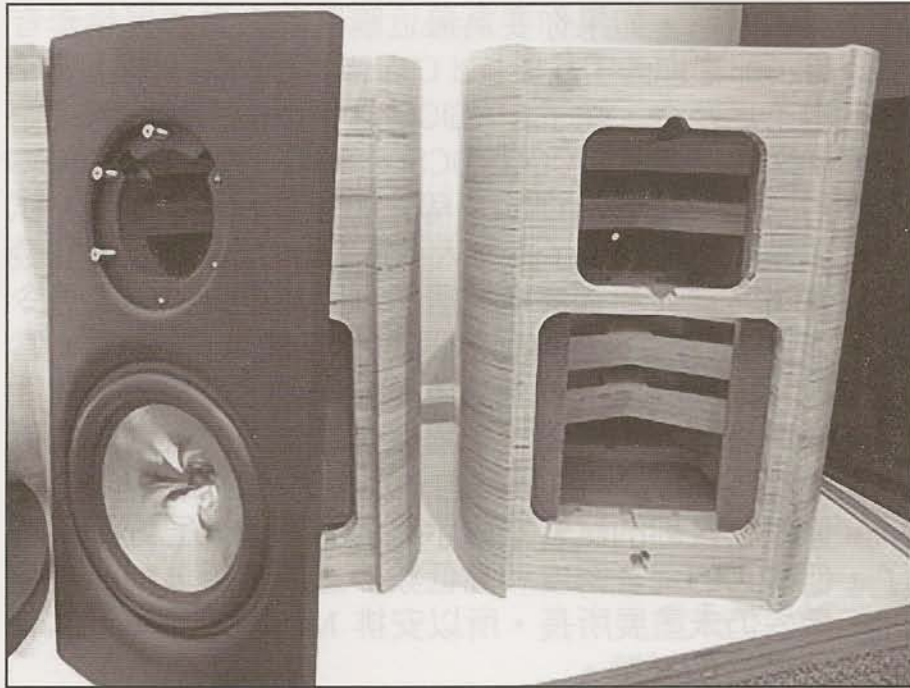
MAGICO Mini —— 航空鋁材與樺木夾層結合的音箱。

MAGICO Mini 係歷來製作成本最高的細喇叭，對有關的製作細節感興趣的讀者可直接上其網址瀏覽( www.magico.net )，簡略地說，Mini 的面板用航空級鋁材鑄製，音箱則用多層樺木夾層壓成，每個音箱淨重 87 磅，而原身腳架亦係用鋁材及多層樺木併夾而成，腳架每個重 120 磅，比音箱更重（資深發燒友就會明白，腳架任何時候都應該重過音箱），即是說，音箱與腳架加起來每聲道使用了超過 200 磅的樺木與鋁材，純以材料計算，其製作成本已高過現今世上大部份揚聲器（不論大細），當然，MAGICO Mini 雖然成本高昂，製作上無所不用其極，但是否物有所值，最終仍須視乎其聲音表現而定。