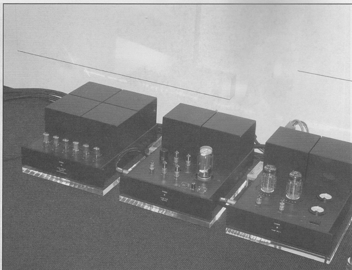
今次試聽依然採用全套 LAMM AUDIO 後級，中間的 ML3 Signature 負責中高 / 中音 / 低音，而右邊的 ML1.1 則只負責獨立推高音。

三路輸出，當經過解碼器轉換成模擬訊號之後，便可接駁擴音體系，從而去推動高音（6,000Hz 以上）、中高 / 中音 / 低音、超低（100Hz 以下）。