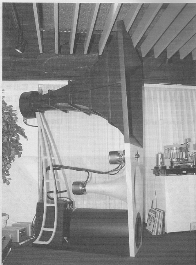
Ultimate II 身高八呎，體重八百磅，以現代新製揚聲器來說，不管是否號角，相信已達終極了。

眾所週知，本社編輯部同仁均是不折不扣的號角發燒友，而我們的試音室亦一直長駐一套由《麗磁》HT-70 勵磁高音 + JBL 375 中音配複刻 WE 22A Horn 咀 + JBL C55 低音所組成的大型號角體系作為參數，所以，當我們得知美國 Hi-End 揚聲器新貴 MAGICO 的旗艦 Ultimate II 乃採用號角型式時，那當然令我們雀躍萬分（試想連當今最頂尖的現代 Hi-End 品牌也以號角去打造