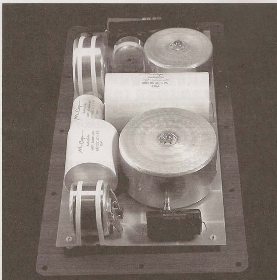
MAGICO V3 內置分音器——用料不計成本。

Mini 中音之質感和魅力，而 MAGICO V3 的中音表現就與 Mini 同出一轍（畢竟兩款喇叭係出自同一設計者），而由於 V3 係座地設計，音箱體積較大，低音也比較豐滿，所以播放 Pavarotti 或低音大提琴時便比 Mini 更具說服力，正由於 MAGICO V3 的中音是如此充滿感情和動力，以致我在聽完家中的《西電》古董之後再聽 V3，便不再感到若有所失，我評論音響器材一貫將中音表現排列在最重要的位置，因為如果中音不好，便難以聽下去，我認為，作為動圈喇叭，MAGICO V3 重播中音可得滿分。