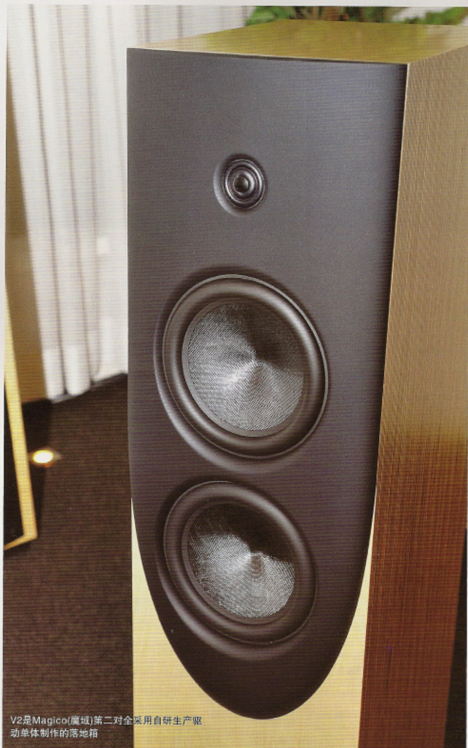
V2是Magico(魔域)第二对全采用自研生产驱动单体制作的落地箱

实试V2的工作，重播了Cisco出品的24K金再版，Jennifer Warnes《Famous Blue Raincoat》(蓝雨衣)碟内的第3轨同名点题歌曲后，我从那份优美细腻及极人性化的音响效果中，或多或少感受到矗立在眼前的这对V2，音响脾性贴近同厂的Mini II，而似乎有别于同是“V系列”中的落地式V3！那究竟是功放使然还是V2的个性