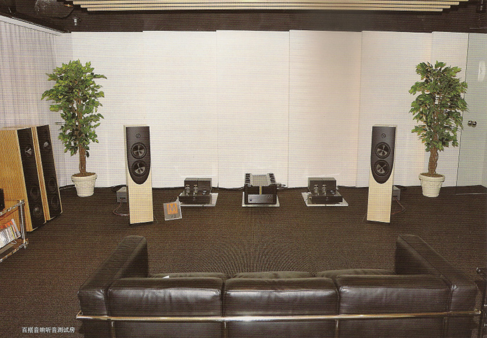
百搭音响听音测试房

除了同厂出品的旗舰级型号 Ultimate II 无缘见识之外，我过去先后经历过美国 Magico(魔域)的扬声器包括 2路2单元书架式 Mini II、3路4单元落地式 V3、3路5单元落地式 M5、以及 4路6单元落地式 Model 6 Series 2。自问对这家创立了超过 10 年，而生产基地设立在美国北加州旧金山湾区，从事专研密封式音箱的 Hi-End 扬声器制造厂家，各个级别的出品具有相当的认识。