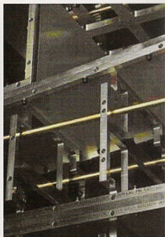
Magico Q5的箱体制作，箱体采用加强的铝合金骨架为基础，外层为加厚铝合金铝板镶嵌